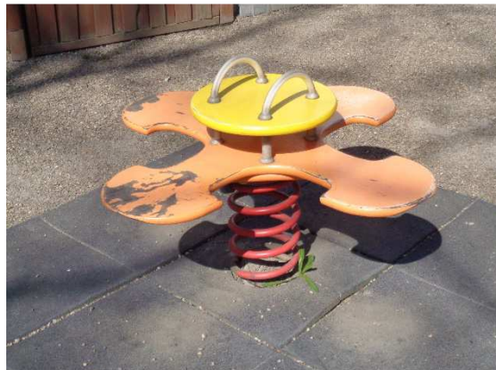
Fot. Proponowana forma stylistyczna elementów placu zabaw

Należy zaprojektować okrągłe kosze na śmieci. Konstrukcja kosza w technologii betonu płukanego. Wkład okrągły z blachy ocynkowanej wyposażony w popielniczkę pełniącą funkcję uchwytu. Pojemność kosza 70L. Wymiary \varnothing 62 x wys. 82 cm.